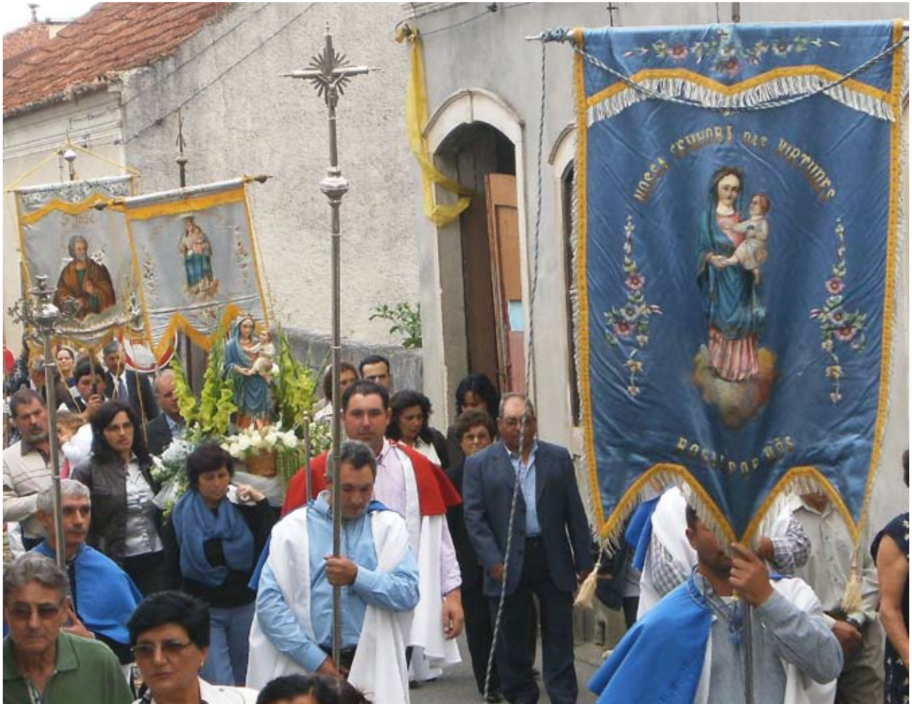
Procissão de Santo António