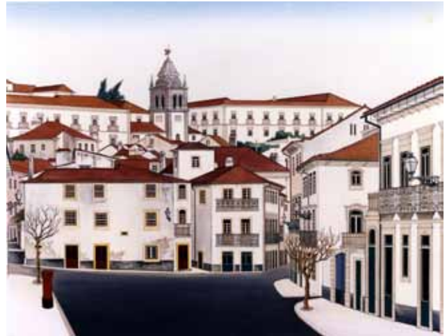
COSTA BRITES LEIRIA, “O TERREIRO”, DO TRIGO, ACRÍLICO S/ TELA S/ PLATEX

Vivo há quase quarenta anos em Coimbra e vim à luz em Cernache do Bonjardim, que era onde estava nesse instante a minha mãezinha, em casa do meu avô materno. Se me perguntam de onde sou, não consigo porém evitar dizer que sou de Leiria, terra de cujos arredores era originário meu pai, da freguesia do Arrabal, pátria de nascimento de tantas dúzias de Brites.