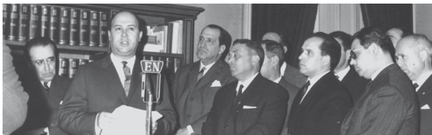
Direcção do sindicato em acto solene. Início dos anos 70.